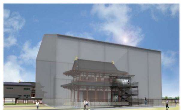
第一次大極殿・南門素屋根イメージ