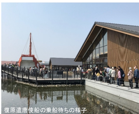
復原遣唐使船の乗船待ちの様子